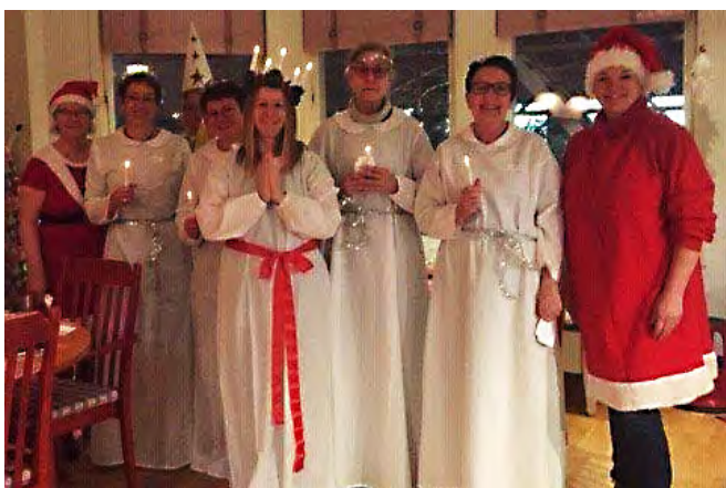
Hospice egenbemannade luciatåg 2019