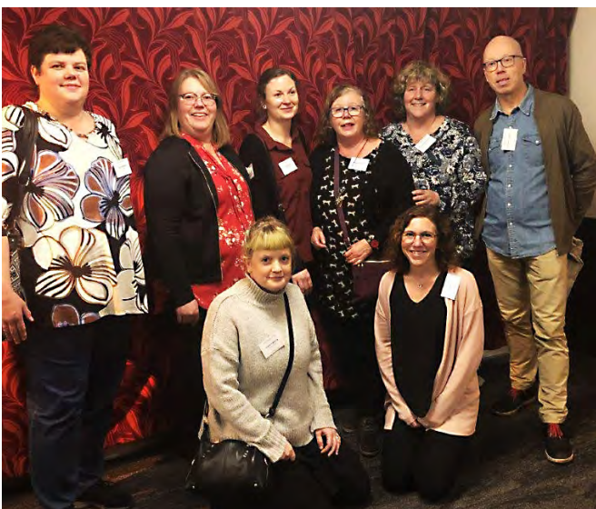
Några medarbetare på en utbildningsdag i Stockholm