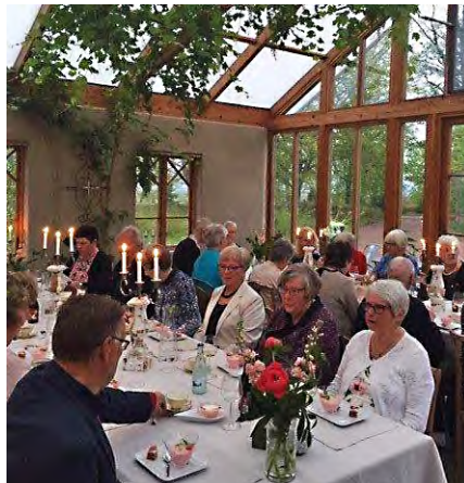
Volontärträff vid Bergets orangeri