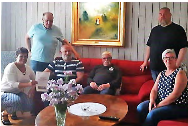
Vedums MCK besöker Hospice